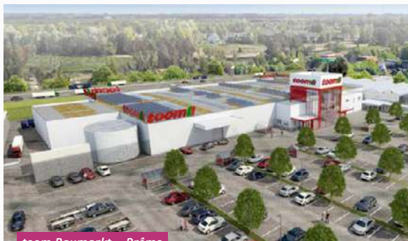
toom Baumarkt - Brême